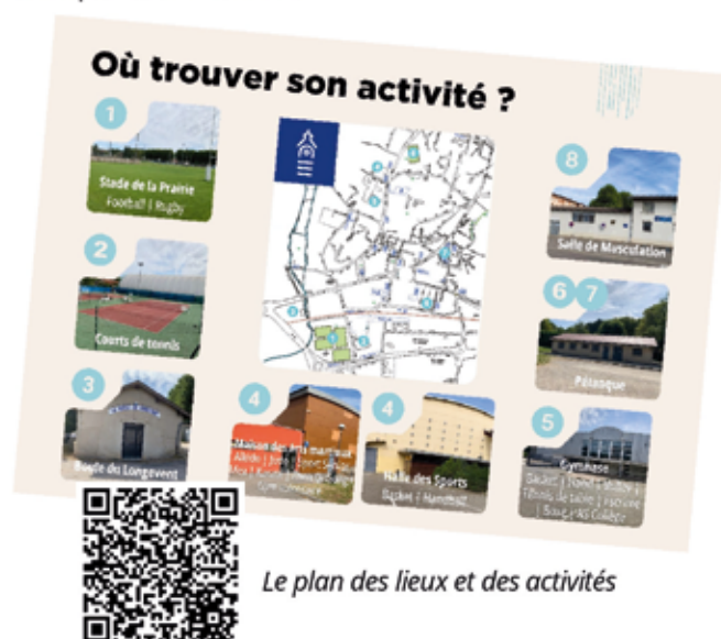
Le plan des lieux et des activités

Vous vous demandez où se déroulent les activités ? Nous vous avons préparé un plan récapitulatif de tous les lieux sportifs de la ville. Du stade de la Prairie à la Halle des Sports en passant par le pétanquodrome et la salle de musculation, ce sont 9 lieux dédiés au sport que la ville entretient pour vous. Flashez le QR code pour avoir le détail et savoir où se trouvent les entraînements de chaque association.