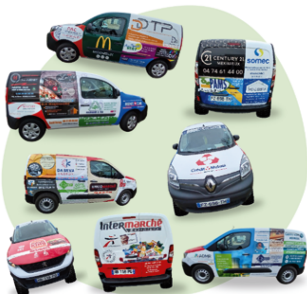
Les 2 camionnettes, vues de toutes les faces

Un immense merci à nos partenaires, Visiocom et trafic Communication, ainsi qu'à tous nos sponsors : Intermarché, EDF, El Maxime Lecieux, L'Aquarelle, SAS Teddy Quinson, Busiris Genie Service, Maevann, Bloom Ink, ADMR, SAS Vetdepro, Gamm Vert, Eurl Da Silva Energy, Burger King, Bricomarché, Mc Donald's, Somec, Century 21, Crédit Mutuel, PAMS, Reno Bugey, SARL Ain Paradis Vert, SARL Juenet Serge, Carl A Peinture, Bouclier Assurances, Rent A Car Côtière, DV Maçonnerie, PAC Charpente, Chez Luccio, SARL Fournand & Fils et SARL DDTP.