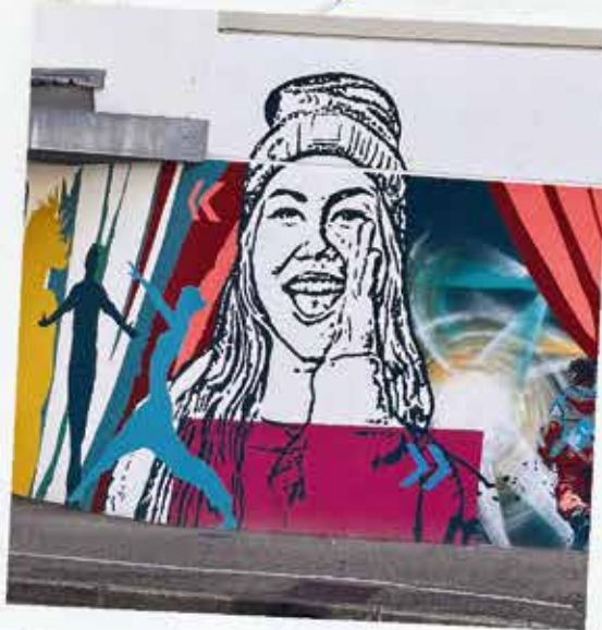
Inauguration de la fresque participative