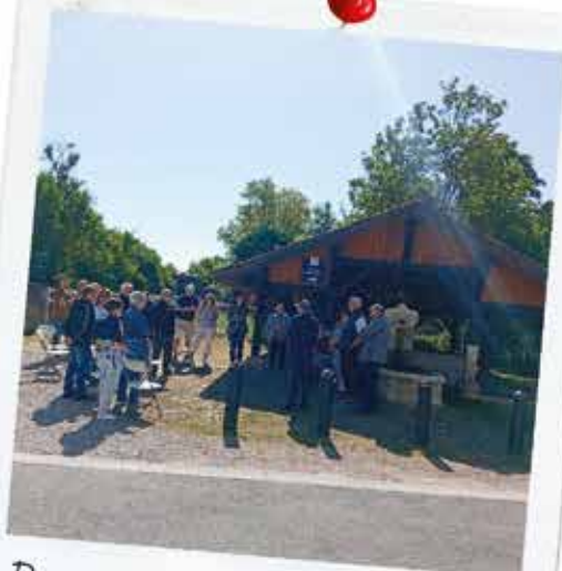
Réunion de quartier avec le maire et le conseil municipal