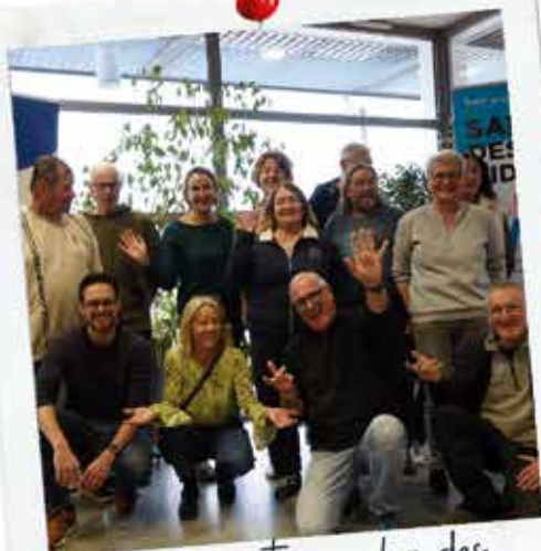
44 exposants au salon des aidants