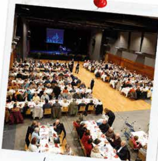
Le repas des aînés