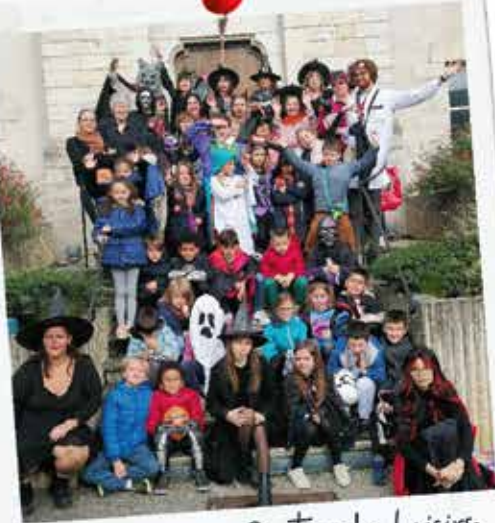
Halloween au Centre de Loisirs