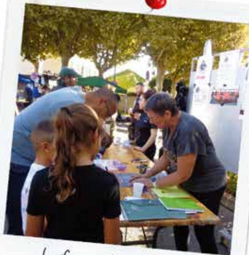
Le forum des associations