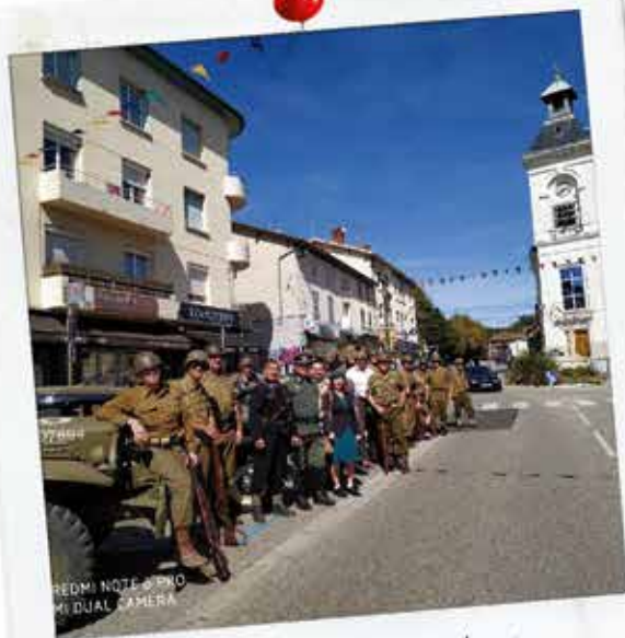
Commémoration de la bataille de Meximieux

Une sélection des meilleurs moments partagés ensemble depuis le dernier Mag'