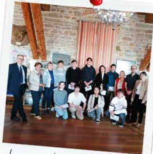
La remise des chèques cadeaux aux mentions TB