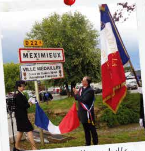
Meximieux, ville médaillée de la Résistance