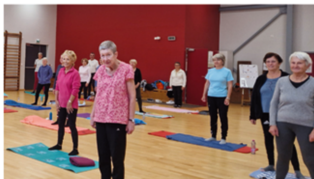
Les adhérents en pleine séance de gymnastique

Si vous souhaitez retrouver ou conserver votre potentiel santé, l'association « Gymnastique Volontaire de Meximieux » est faite pour vous, sans limite d'âge.