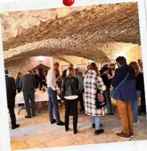
L'accueil des nouveaux arrivants