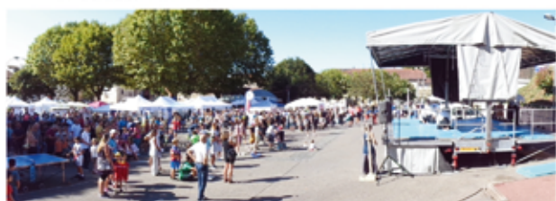
L'édition 2025 du forum des associations