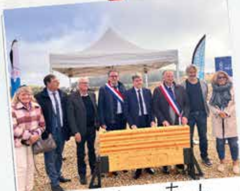
Pose de la 1ère poutre du gymnase du lycée