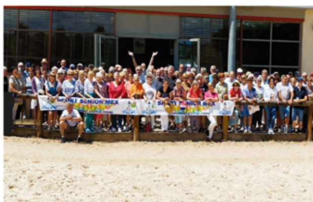
Les adhérents de Sport Senior Mex