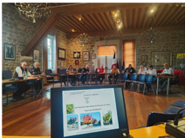
La nouvelle commission extra-municipale au travail

Genève et Avenue Boyer. Une typologie végétale doit être définie pour établir un cahier de recommandations végétales qui doit prendre en compte un impact minimal de l'eau, le changement climatique et des essences adaptées à l'environnement.