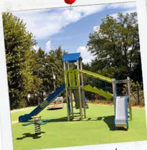
Inauguration de l'aire de jeux des Carronnières