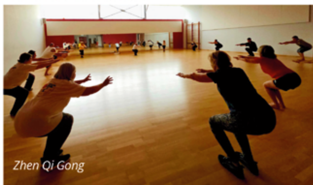
Rattaché à la Fédération d'Enseignants de Qi Gong et Arts Energétiques et à la Fédération EPMM SPORTS pour TOUS