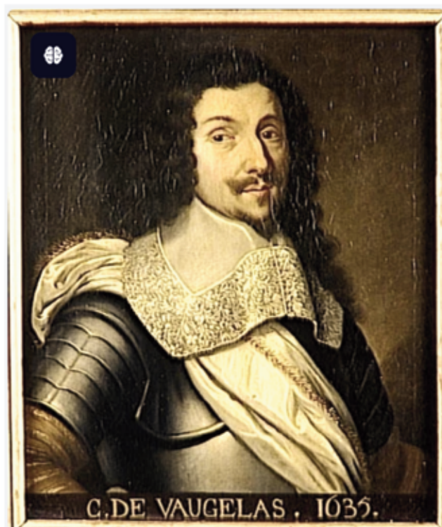
Portrait à l'huile de Claude Favre de Vaugelas