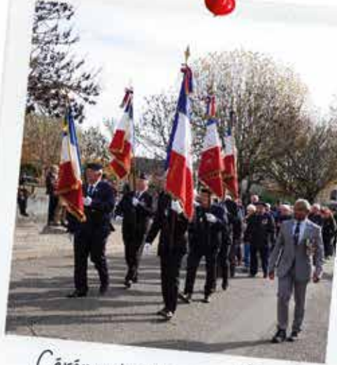
Cérémonie commémorative du 11 Novembre