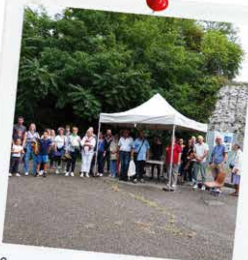
Journée du patrimoine au château