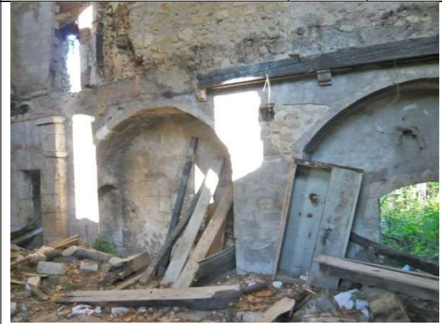
Intérieur château – aile O (oct. 2015)