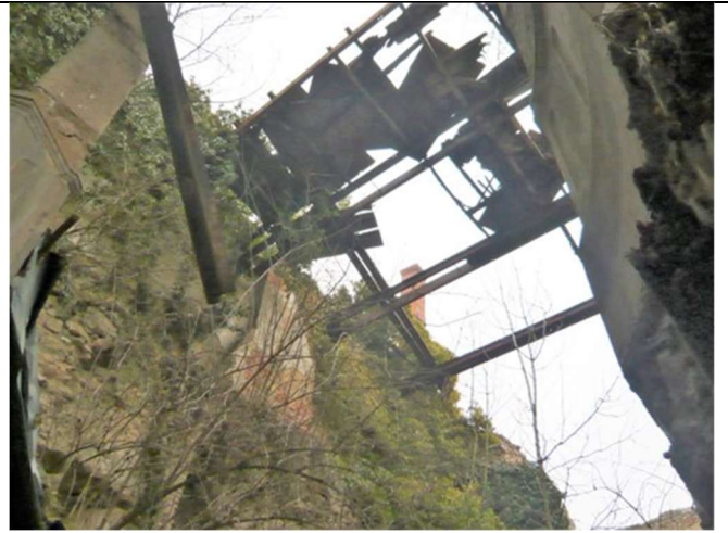
Intérieur du château - partie centrale (janv 2017)