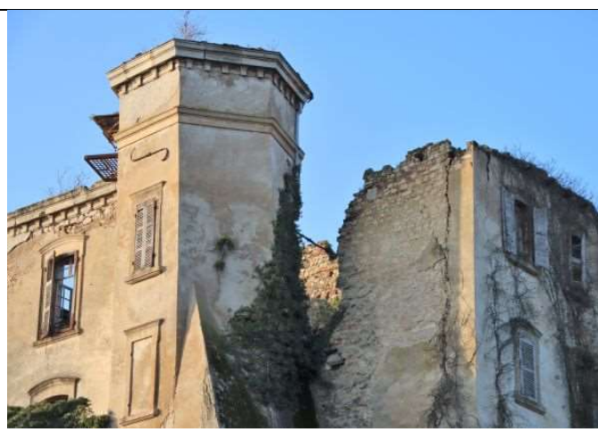
Fissure tour carrée E et disparition partie supérieure du mur de liaison des deux tours E (janv 2020)