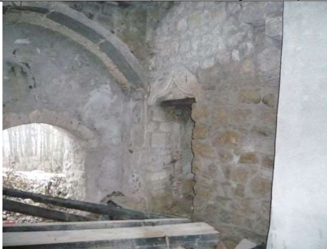
Intérieur château – aile O (oct. 2015)