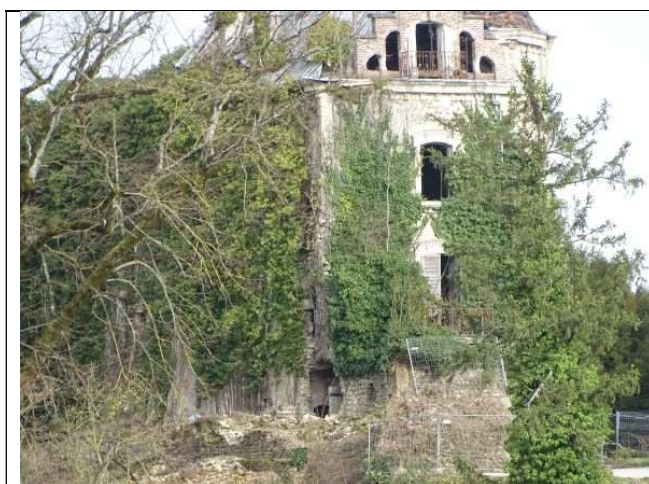
Brèche à la base façade O (avril 2018)