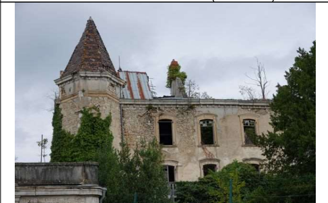
Façade S, côté O, et tour O (oct. 2020)