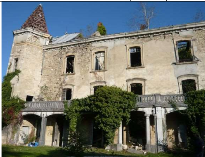
Façade S (oct. 2015)