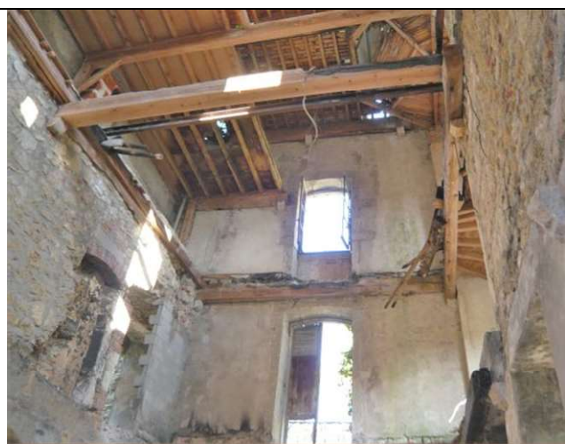
Intérieur château – aile O (oct. 2015)