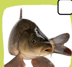
La carpe commune