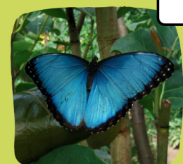
Le morpho bleu

2 Je mange du riz car le pain me rend malade et pollue mon eau. Qui suis-je ?