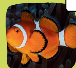
Le poisson clown