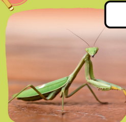
La mante religieuse

3 Je suis verte et j'habite les mares et les étangs. Qui suis-je ?