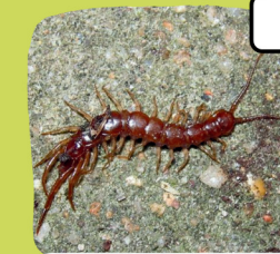
La lithobie à pinces