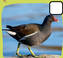
La poule d'eau

2 Je mange du riz car le pain me rend malade et pollue mon eau. Qui suis-je ?